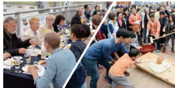
다리위의 향연 & 인절미 축제 Feast on the Bridge & Injeolmi Rice Cake Festival