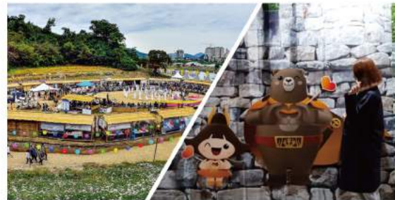
공주캐릭터 페어, 백제홍보관, 웅진체험마당 Gongju Character Fair, Baekje Exhibition Hall, Ungjin Experience Site