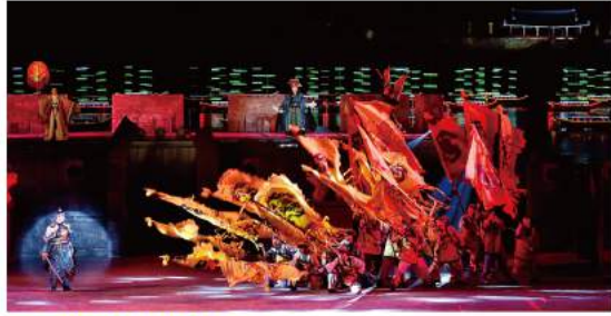
웅진판타지아 공연 Woongjin Fantasia Show