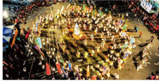
대백제의 혼 웅진성 퍼레이드 Soul of Great Baekje, Ungjin Fortress Parade