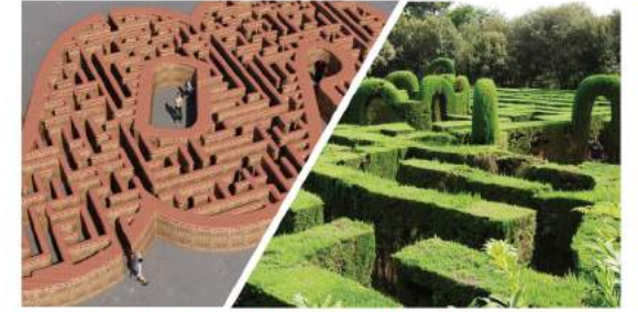
백제메이프 "미로로 떠나는 백제" Baekje Maze "Journey to Baekje's Maze"