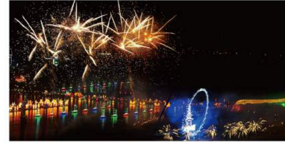
백제한화불꽃축제 Baekje Hanhwa Fireworks Festival