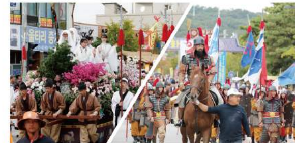
하이테크 백제퍼레이드(백제역사문화행렬) High-Tech Baekje Parade (Baekje's History and Culture Parade)