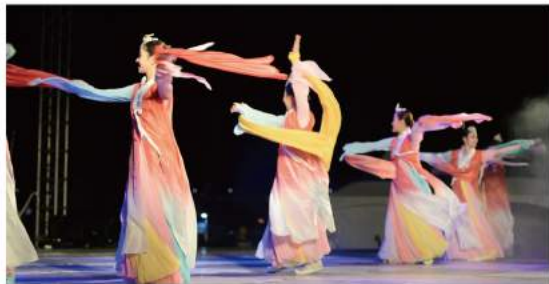
세계유산을 품은 공산성 왕실연회 Gongsanseong Fortress Royal Family Banquet of World Heritage