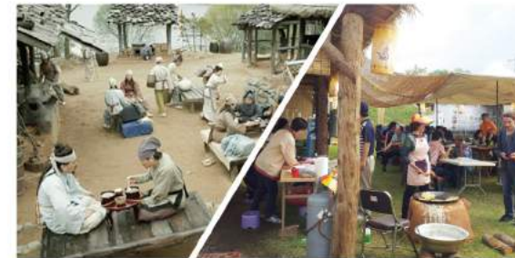
국제무역항 구드래나루 퍼쫓거리 Market Street of Ancient Baekje's International Trade Port, Gudeurae Naru