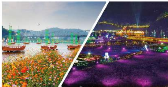
금강 백제등불향연 & 미르섬 백제별빛정원 Baekje Light Feast & Baekje Starlight Garden on Mir Island