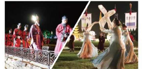
백제천도! 사비왕궁 대연회 Baekje's New Capital, Sabi! The Great Banquet of Sabi Royal Palace