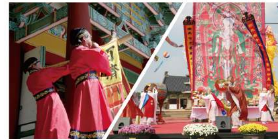
삼충제, 수륙대제 등 8개 제물전 Baekje's Eight Royal and Buddhist Ceremonies including the Samchoongje Ceremony and Great Land and Water Ceremony