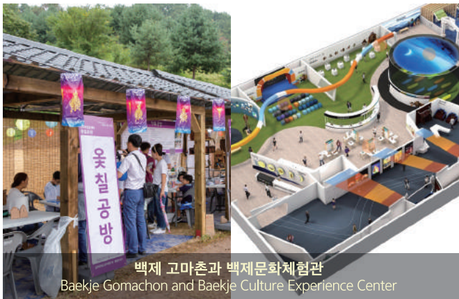
백제 고마촌과 백제문화체험관 Baekje Gomachon and Baekje Culture Experience Center