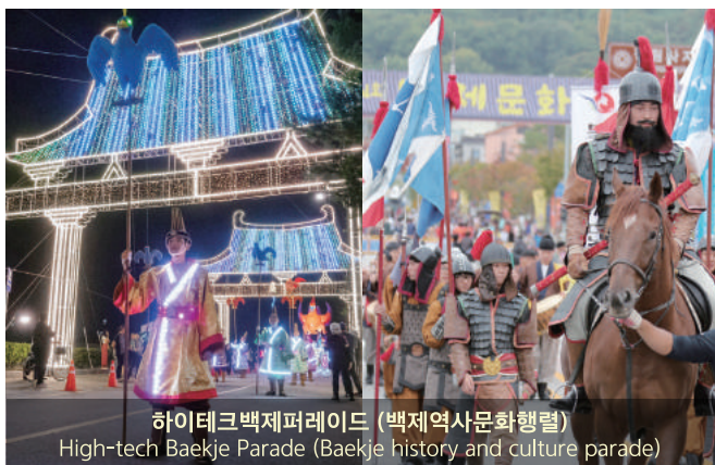
하이테크백제퍼레이드 (백제역사문화행렬) High-tech Baekje Parade (Baekje history and culture parade)