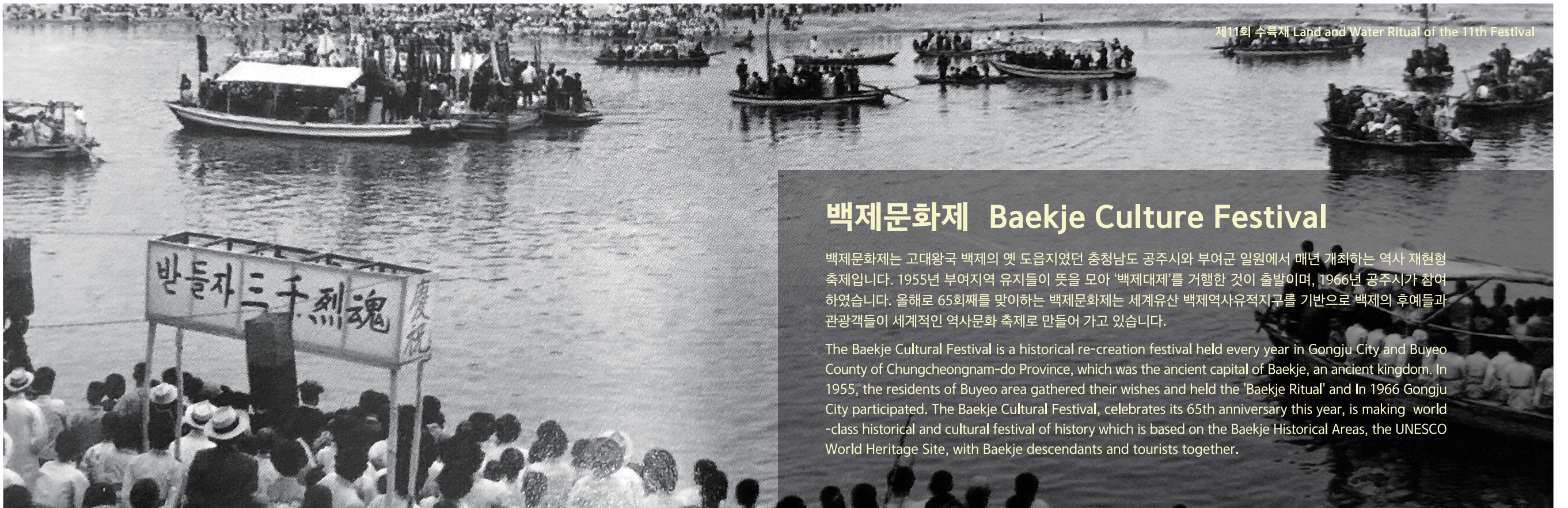
제11회 수륙제 Land and Water Ritual of the 11th Festival