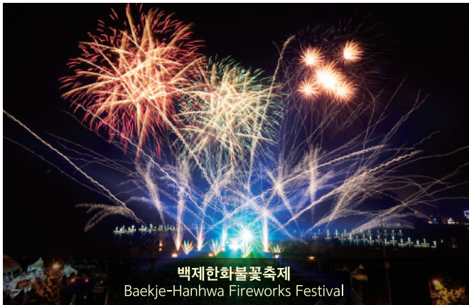
백제한화불꽃축제 Baekje-Hanhwa Fireworks Festival