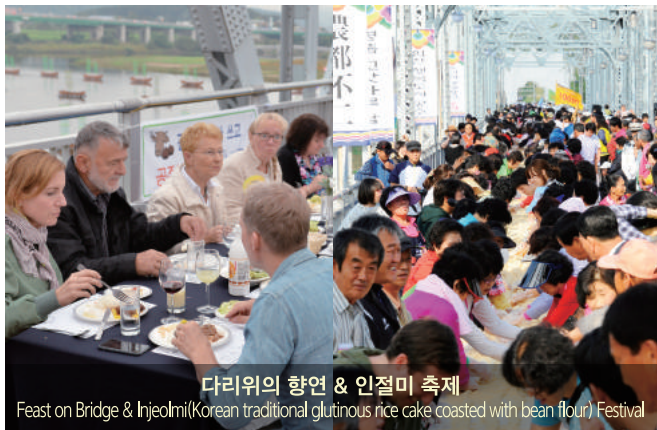
다리위의 향연 & 인절미 축제 Feast on Bridge & Injeolmi(Korean traditional glutinous rice cake coated with bean flour) Festival