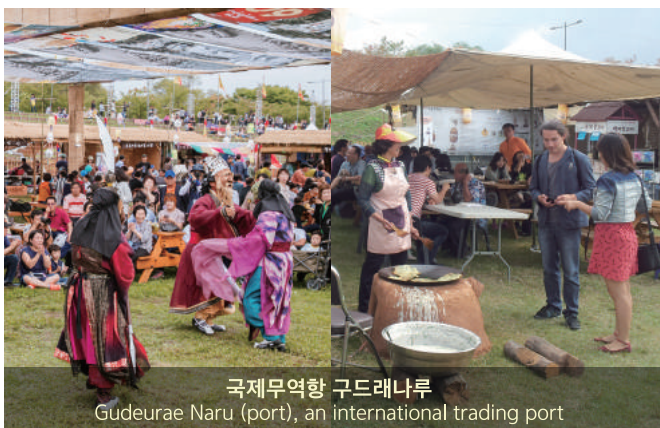
국제무역항 구드레나루 Gudeurae Naru (port), an international trading port