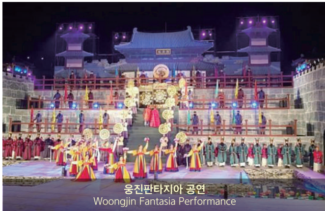
웅진판타지아 공연 Woongjin Fantasia Performance

The Baekje Cultural Festival is a historical re-creation festival held every year in Gongju City and Buyeo County of Chungcheongnam-do Province, which was the ancient capital of Baekje, an ancient kingdom. In 1955, the residents of Buyeo area gathered their wishes and held the 'Baekje Ritual' and In 1966 Gongju City participated. The Baekje Cultural Festival, celebrates its 65th anniversary this year, is making world-class historical and cultural festival of history which is based on the Baekje Historical Areas, the UNESCO World Heritage Site, with Baekje descendants and tourists together.