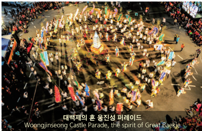
대백제의 혼 웅진성 퍼레이드 Woongjinseong Castle Parade, the spirit of Great Baekje