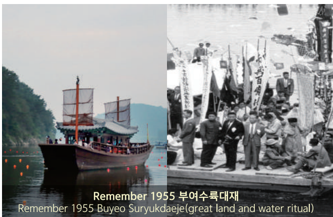
Remember 1955 부여수륙대제 Remember 1955 Buyeo Suryukdaeje(great land and water ritual)