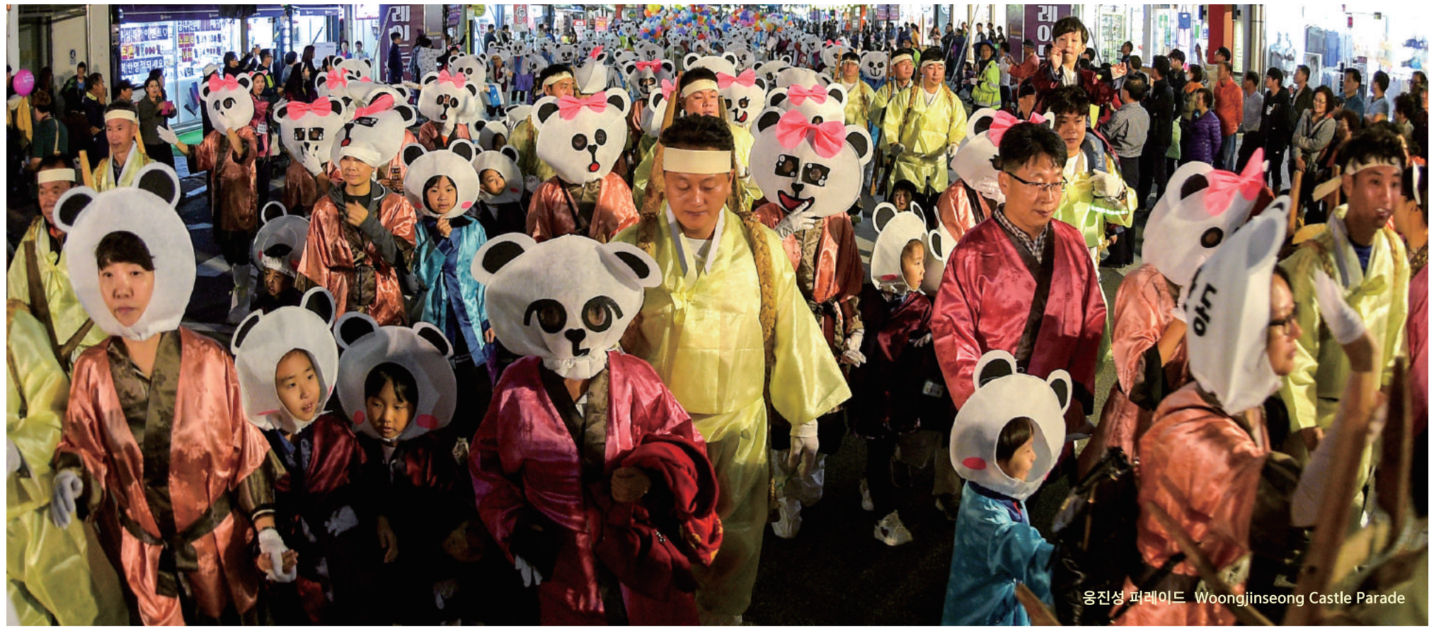
웅진성 퍼레이드 Woongjinseong Castle Parade

Travel back in time to the era of Baekje