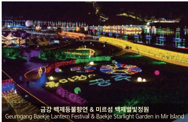
금강 백제등불향연 & 미르섬 백제별빛정원 Geumgang Baekje Lantern Festival & Baekje Starlight Garden in Mir Island