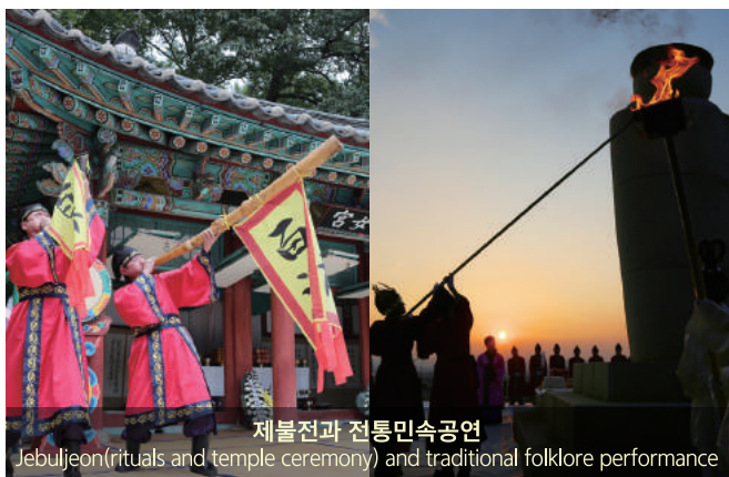
제물전과 전통민속공연 Jebujeon(rituals and temple ceremony) and traditional folklore performance