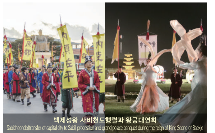
백제성왕 사비천도행렬과 왕궁대연회 Sabijeon(transfer of capital city to Sabi) procession and grand palace banquet during the reign of King Seong of Baekje