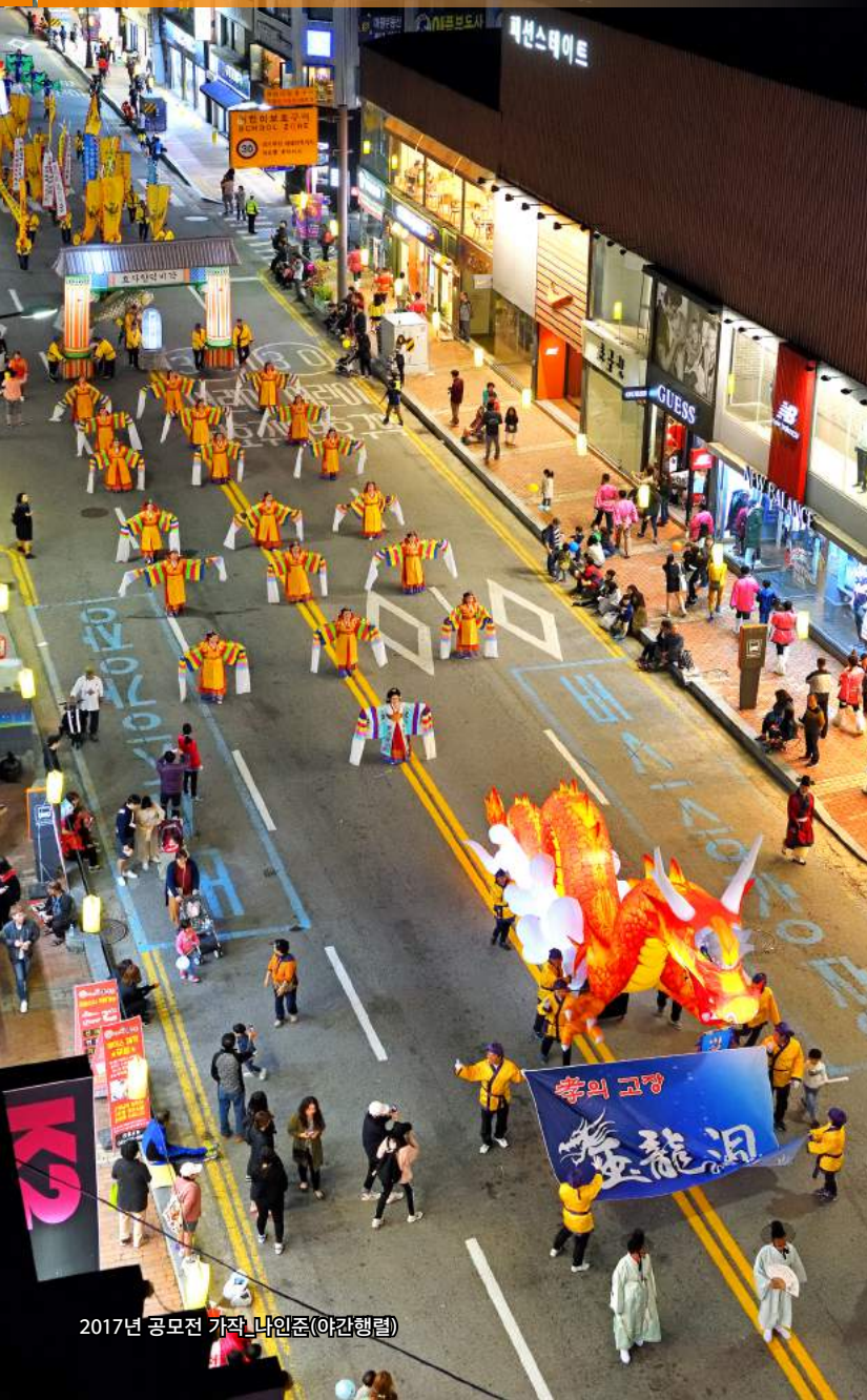
2017년 공모전 가작 나인준(아간행렬)