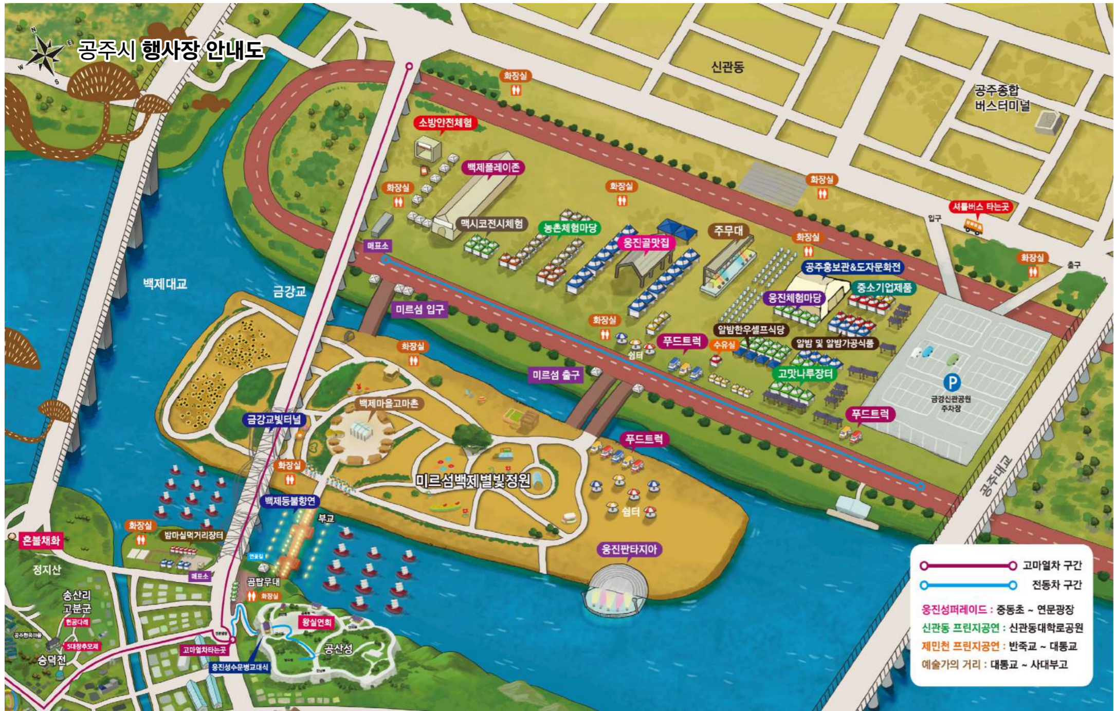
The 65th Baekje Cultural Festival