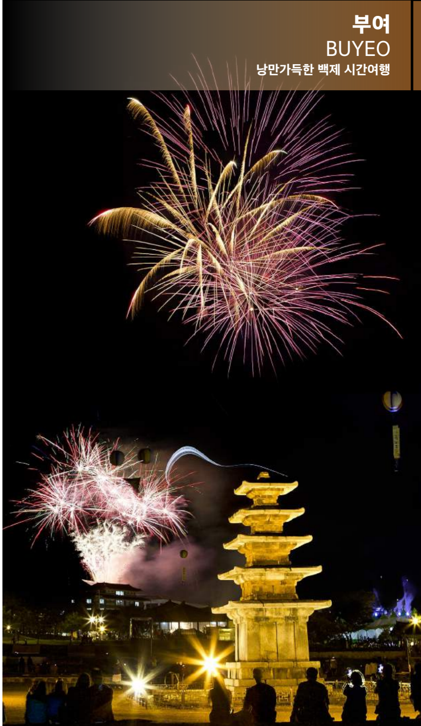
부여 BUYEO 낭만가득한 백제 시간여행